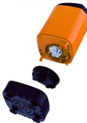
разборное дно помпы

Пожалуйста, проверьте комплектность аксессуаров в упаковке после получения этого продукта. Если аксессуары не в комплекте, свяжитесь с дистрибьютором.